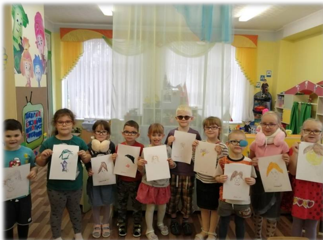
Портреты наших мам...