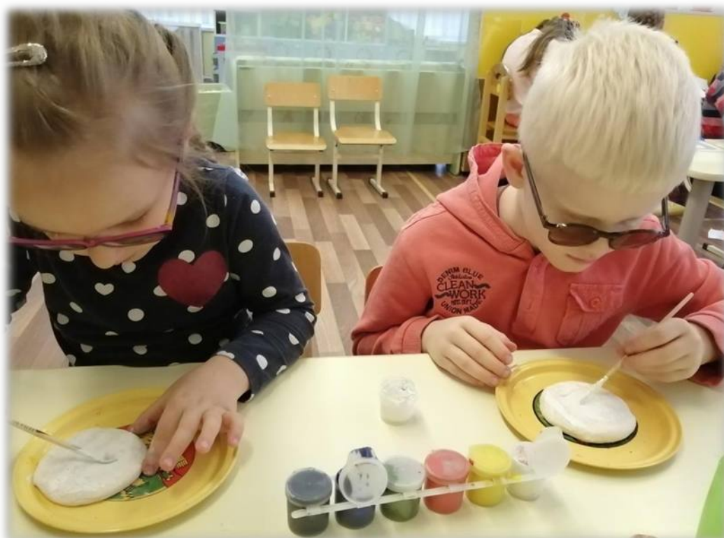
Делаем подарки мамам...